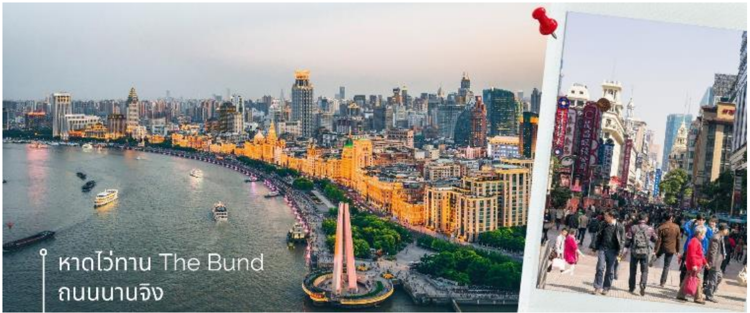
หาดไว่ทาน The Bund ถนนนานจิง

หลังอาหารนำท่านเดินทางกลับเชียงใหม่ นำท่านเดินทางสู่แลนด์มาร์คของเมืองเชียงใหม่ นักท่องเที่ยวทั้งชาวจีนและชาวต่างชาติ ต่างพากันมาถ่ายรูปอย่างไม่ขาดสาย เมื่อมาถึงเมืองเชียงใหม่ นั่นคือ หอไข่มุกตะวันออก Oriental Pearl Tower (ผ่านชม) เป็นหอส่งสัญญาณวิทยุโทรทัศน์สูง 468 เมตร ลักษณะเป็นไข่มุก 11 ลูก และ เสา 3 เสา ด้านบนเป็นรูปไข่มุก 3 เม็ด 3 ขนาดเรียงกันในแนวตั้ง เมื่อชมวิว ถ่ายรูปกันจนหน้าใจแล้ว นำท่านเดินมาทางเข้าอุโมงค์เลเซอร์ ซึ่งเป็นอุโมงค์ลอดแม่น้ำแห่งแรกในประเทศจีนโดยอุโมงค์นี้จะพาเราเดินทางข้ามจากฝั่งหอไข่มุกตะวันออก ของหาดไว่ทาน จากนั้นนำท่านเปิดประสบการณ์ใหม่กับ The Bund Sightseeing Tunnel อุโมงค์เลเซอร์ เชียงไฮ้ ถูกสร้างขึ้นเพื่อให้ใช้เป็นเส้นทางขนส่งนักท่องเที่ยวกรุ๊ปใหญ่ๆ ที่มาเที่ยวที่นครเชียงใหม่ ทางนครเชียงใหม่ได้ติดตั้งระบบแสงสีเสียงสุดอลังการ