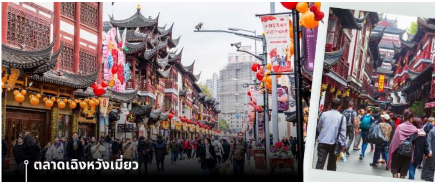
ตลาดเฉิงหวังเมี่ยว

จากนั้นนำท่านชม ตลาดเฉิงหวังเมี่ยว หรือเป็นที่รู้จักในชื่อ ตลาด 100 ปี เฉิงหวังเมี่ยว เมืองเซี่ยงไฮ้ (Chen Wang Miao) ถือว่าเป็นตลาดเก่าของผู้ตง เมืองเซี่ยงไฮ้ อาคารบ้านเรือนบริเวณนี้เป็นสถาปัตยกรรมโบราณสมัยราชวงศ์หมิงและชิง ตกแต่งสไตล์สถาปัตยกรรมแบบโบราณจีน และเก่ากว่าร้อยปี