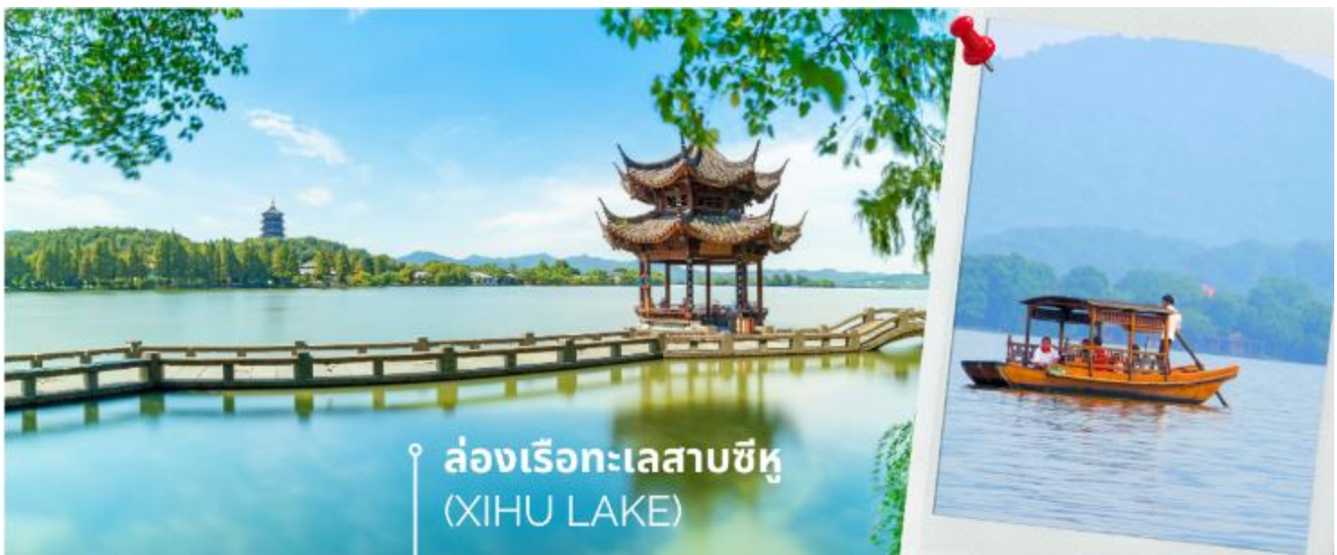
ล่องเรือทะเลสาบซีหู (XIHU LAKE)

เมืองหางโจว (HANGZHOU) หรือ ฮังโจว เป็นเมืองที่ตั้งอยู่ในประเทศจีน ซึ่งตั้งอยู่ทางตอนตะวันออกของประเทศ เมืองหางโจวเป็นเมืองเก่าแก่ 1 ใน 6 ของประเทศจีน ปัจจุบันหางโจว ถือเป็นเมืองที่อยู่ในเขตภาคตะวันออกที่ได้รับการพัฒนาอย่างสูงสุดแล้ว ดังนั้นหางโจวจึงเป็นที่รู้จักกันเป็นอย่างดีว่า เป็นเมืองที่มีความสำคัญทางเศรษฐกิจ มีวัฒนธรรมที่ยาวนาน