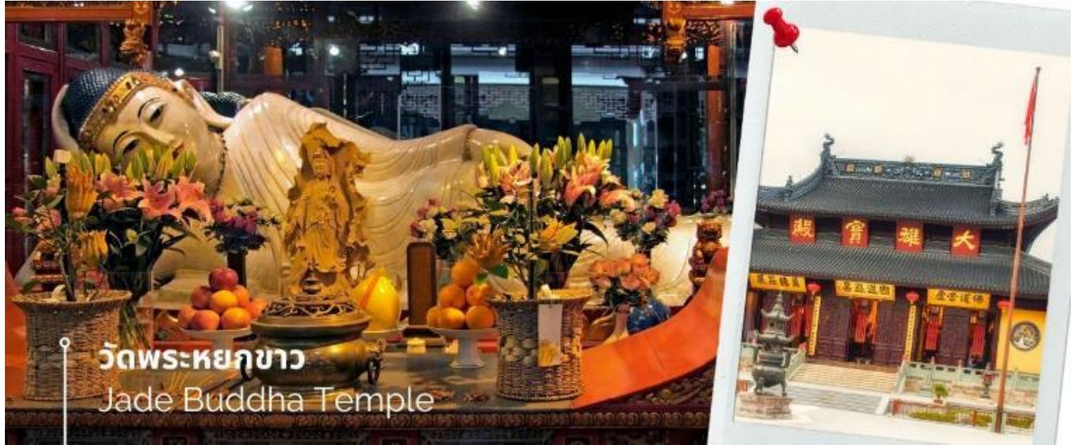
วัดพระหยกขาว Jade Buddha Temple

หลังรับประทานอาหารเช้า นำท่านชม วัดพระหยกขาว Jade Buddha Temple เป็นวัดที่มีชื่อเสียงมากที่สุดในเมืองเซี่ยงไฮ้ ซึ่งเป็นที่รู้จักจากพระพุทธรูปสององค์ที่สร้างขึ้นจากหยกทั้งแท่ง องค์พระพุทธรูปปางนั่งมีความสูง 190 เซนติเมตร และ หุ้มด้วยเพชรพลอย หิน มโนรา และ มรกต และองค์พระพุทธรูปปางไสยาสน์ มีความยาว 96 เซนติเมตร นอนเอียงด้านขวาและหนุนพระเศียรด้วยพระหัตถ์ขวา ถือเป็นวัดที่มีทั้งชาวจีนและนักท่องเที่ยวเดินทางมาสักการะบูชา