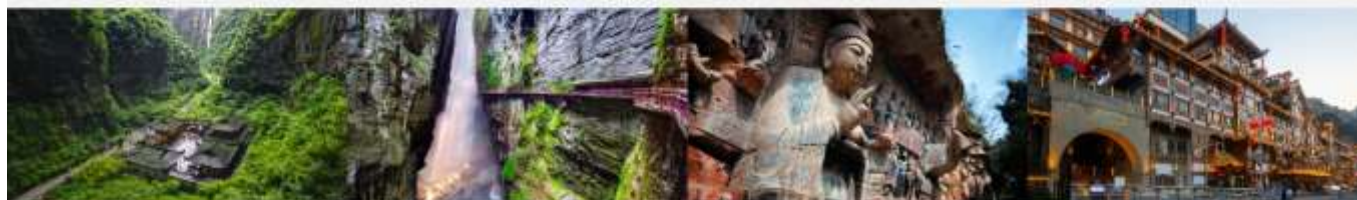
อุทยานแห่งชาติหลุมฟ้า 3 สะพานสวรรค์