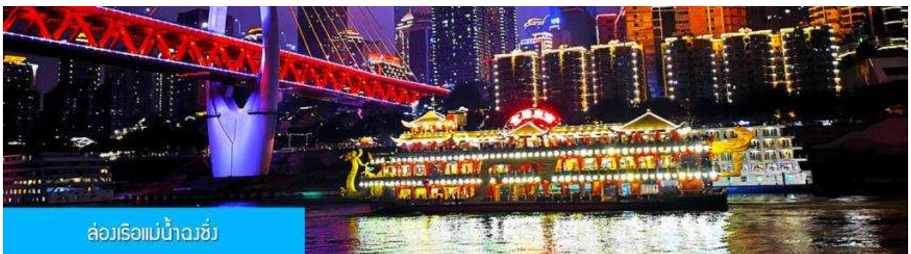
ล่องเรือแม่น้ำฉางชี่

รับประทานอาหารค่ำ ณ ภัตตาคาร (เมนูสุกี้หม่าล่าต้นตำหรับจงชิ่ง)