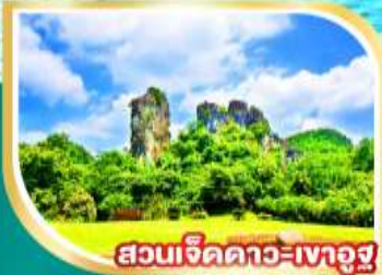
สวนเจ็ดดาว-เงาอุซุ