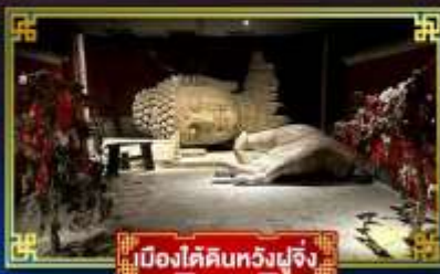
เมืองใต้ดินหวงเผิง

“กำแพงหินลี่”...สิ่งมหัศจรรย์ของโลก พระราชวังต้องห้าม อดีตพระราชวังหลวงสุดยิ่งใหญ่