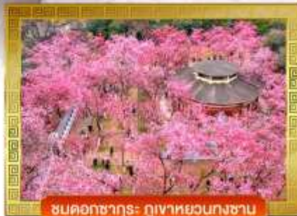
ชมดอกซากุระ ภูเขาหยวงชาน