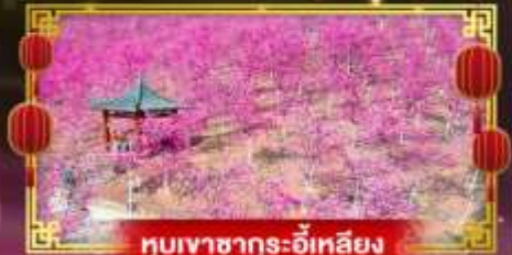
หุบเขาซาถูระอี่หลียง