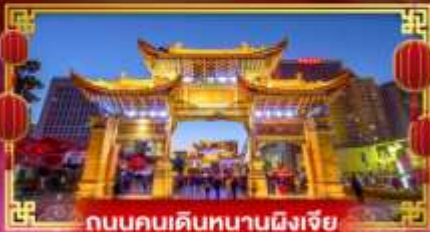
ถนนคนเดินหนานผิงเจีย