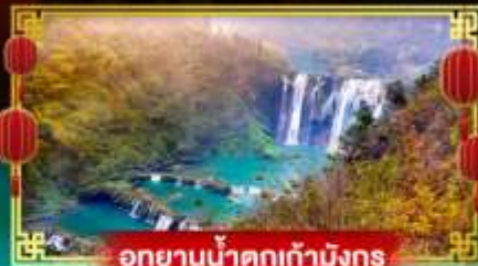
อุทยานน้ำตกเก้ามังกร