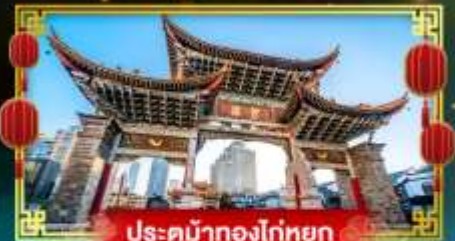
ประตูม้าทองโก่หยก