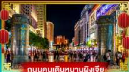
ถนนคนเดินหนานผิงเจีย

“ชมเทศกาลดอกไม้บ้านคุณนง” เที่ยวอุทยานน้ำตกเก้ามังกรสุดอลังการ