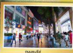
ถนนชุนชี่