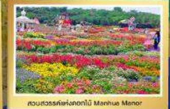
สวนสวรรค์แห่งดอกไม้ Manhuo Manor