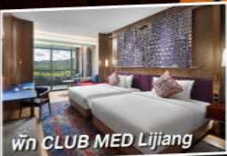
พัก CLUB MED Lijiang