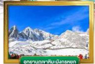
อุทยานภูเขาหิมะมังกรหยก

เดินทางโดยสารการบินโซน่าอิสทีร์นแอร์ไลน์