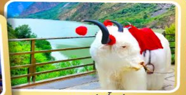
ทะเลสาปเตี้ยซี