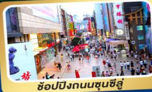
ช้อปปิ้งถนนชุนซีลู่