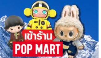
เข้าร้าน POP MART