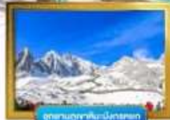
อุทยานภูเขาหิมะมังกรหยก

เดินทางโดยสารการบินจีนนำอิสเทิร์นแอร์ไลน์