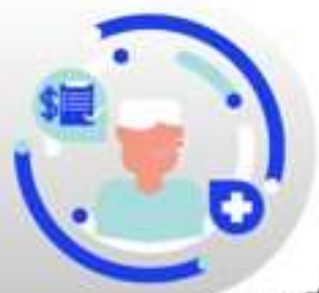
กรณีเจ็บป่วย:

กรณีเจ็บป่วยจนไม่สามารถเดินทางได้ ต้องมีใบรับรองแพทย์จากโรงพยาบาล บริษัทฯ จะทำการเลื่อนการเดินทางของท่านไปยังคณะต่อไป ทั้งนี้ ท่านจะต้องเสียค่าใช้จ่ายที่ไม่สามารถยกเลิก หรือเลื่อนการเดินทางได้ตามความเป็นจริง