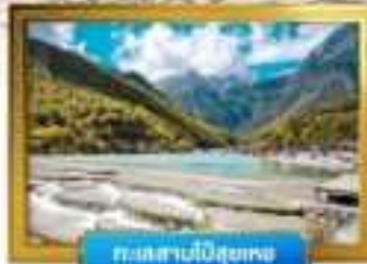
ทะเลสาบป๋อซูหยง