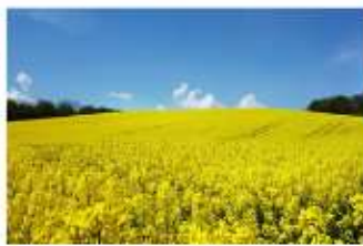
ทุ่งดอกเบี๊ยตาร์ด