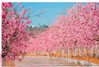
หุบเขายาคุระ