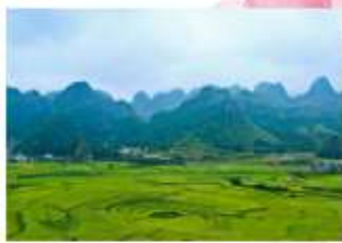
ป่าภูเขาหมื่นยอด