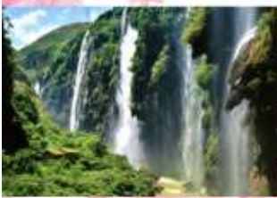
ปัทมกร้อยสาย