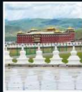
วัดต้ากง