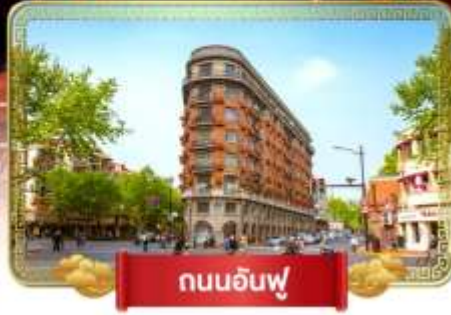
ถนนอันฟู