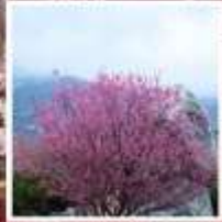
ชมดอกท้อภูเขาไถ่ซาบ