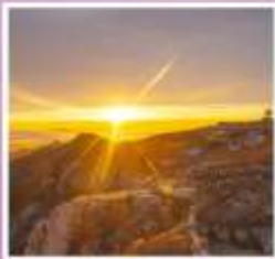
ยอดเขาอวิ้อวาง