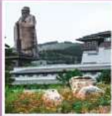
รูปปั้นงจ้อ ที่ใหญ่ที่สุดในโลก