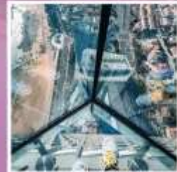
QINGDAO HAITIAN CENTER