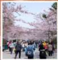
ซากระจงซาน