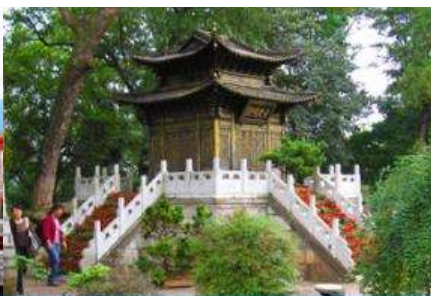
ตำหนักกวงจินเตียน