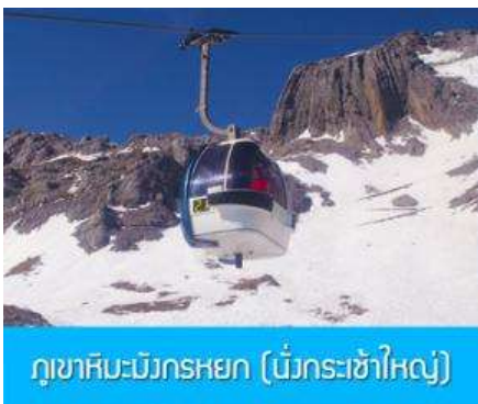
ภูเขาหิมะมังกรหยก (มังกรหิมะใหญ่)

พักที่ FENGHUNG YANGSHENG HOTEL ระดับ 4 ดาวท้องถิ่นหรือเทียบเท่าใน เมืองลี่เจียง