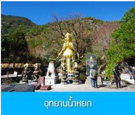
อุทยานน้ำหยก

***โปรดทราบ การแสดงนี้จัดขึ้นบริเวณลานกลางแจ้ง หากมีการงดการแสดงในวันนั้นๆ ไม่ว่าจะด้วยสภาพอากาศหรือกรณีอื่นใด ทำให้ไม่สามารถชมการแสดงได้ ผู้จัดสามารถจัดโชว์พื้นเมืองชุดอื่นมาทดแทนให้ท่านนั้น โดยไม่มีการคืนค่าบริการใดๆ ทั้งสิ้น ***