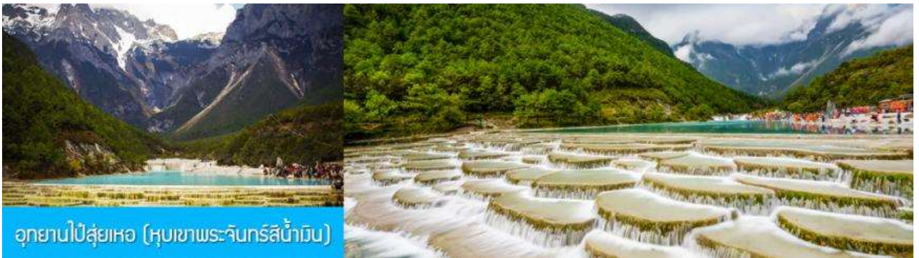
อุทยานไป๋ส่วยเหอ (หุบเขาพระจันทร์สีน้ำเงิน)

หมายเหตุ กรณีที่กระเช้าขึ้นภูเขาหิมะมังกรหยกปิดให้บริการ ด้วยเหตุที่สภาพอากาศไม่เอื้ออำนวย หรือเป็นการปิดเพื่อตรวจสอบสภาพและซ่อมแซมประจำปี ทางทัวร์ขอสงวนสิทธิ์ที่จะจัดโปรแกรมขึ้นกระเช้า ที่จุดชมวิวภูเขาหิมะมังกรหยก ณ สถานีกระเช้าหุ่ยชานผิงแทน