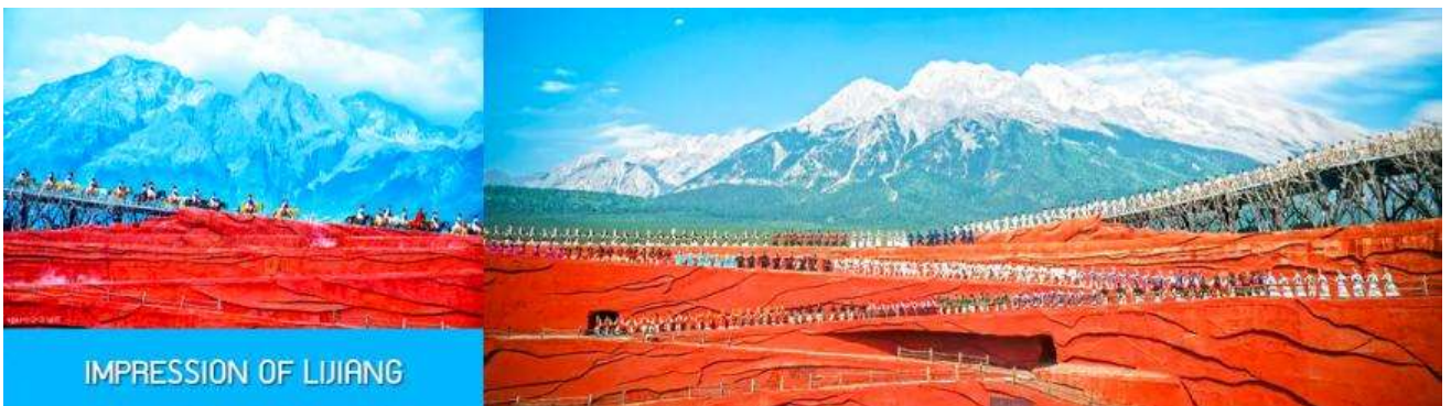
IMPRESSION OF LIJIANG