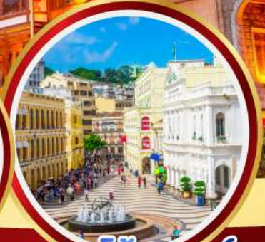
เซนาโตสแควร์