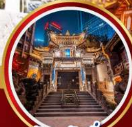
วัดหลัวอัน