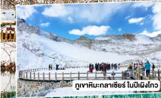
ภูเขาหิมะกลาเซียร์ ในปี่ผิงโกว