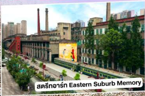
สตรีทอาร์ต Eastern Suburb Memory