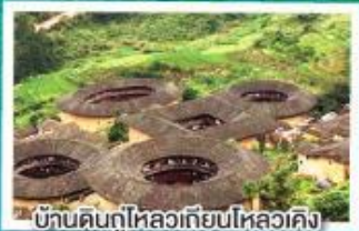
บ้านดินกู่ไหลวเทียนไหลวคิง