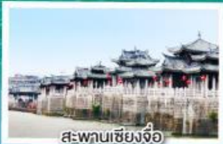
สะพานเซียงจิว