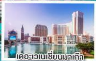
เดอะเวเนเซียนมกเก๊า