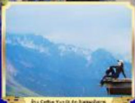
สะพานหิมะมังกรหยก