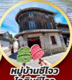
หมู่บ้านซีโจว ไอติมซีโจว