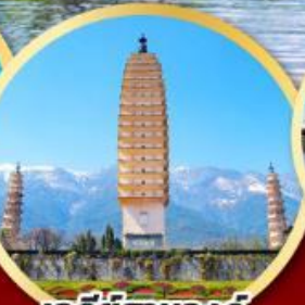
เจดีย์สามองค์