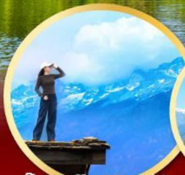
ร้าน Coffee Yun Di An