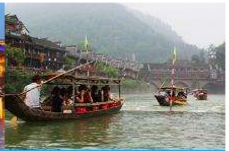
ล่องเรือแม่น้ำถั่วเจียง

วันที่สาม เมืองจางเจียเจี๋ย-ออฟชั่นไกด์ขายสะพานกระจกข้ามเขาแกรนด์แคนยอน - เมืองโบราณฟ่งหวง- ล่องแม่น้ำถั่วเจียง-นอนในเมืองเก่าฟ่งหวง