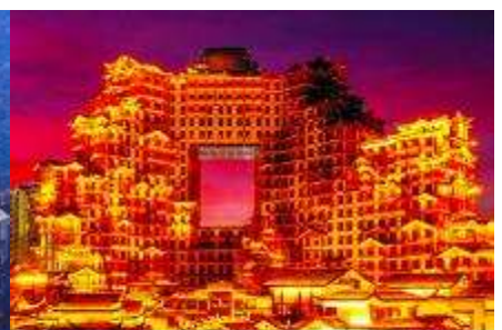
ตึกมหิศวรรษย์ 72 ชั้น