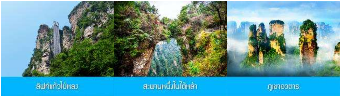
ลิฟท์แก้วไปหลง