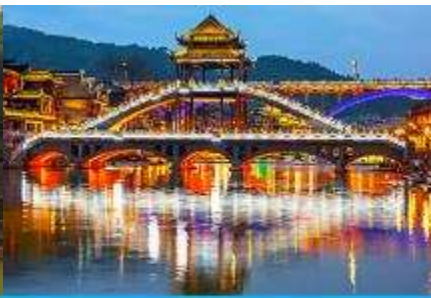
สะพานหวงเจียว