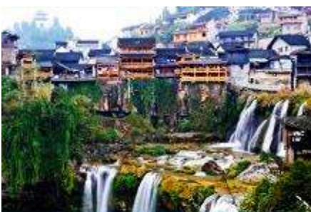
เมืองโบราณฟงหวงจีน

https://www.cielchine.com/zhangjiajie-hotels/zui-xiang-xi-hotel/