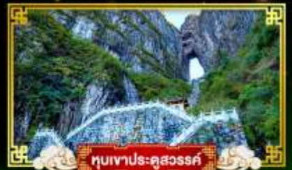
หุบเขาประตูสวรรค์