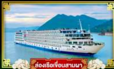
ล่องเรือเขื่อนสามผา