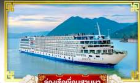
ล่องเรือเขื่อนสามผา