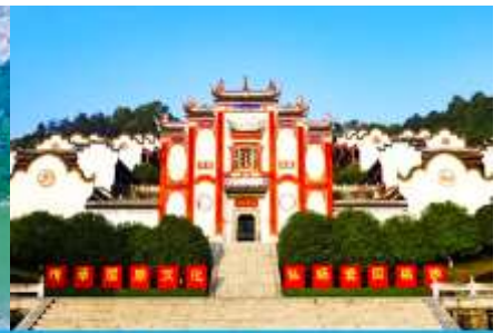
บ้านเกิดกวี ขิวหยวน