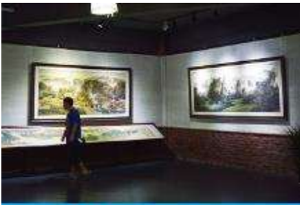
พิพิธภัณฑ์ภาพหินทราย

พักที่ ZHENMIN HOTEL โรงแรมระดับ 4 ดาวหรือเทียบเท่า