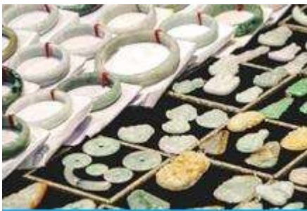
ศูนย์จำหน่ายผลิตภัณฑ์หยก