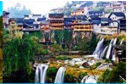
เมืองโบราณฝูหรงเจิน