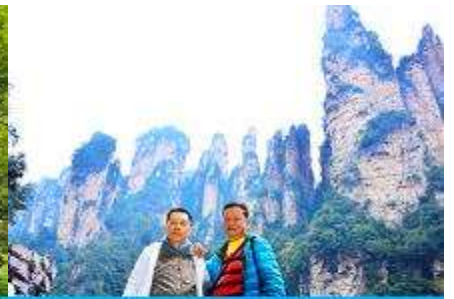
ชมจุดชมวิวลีฟท์แก้ว

วันที่ห้า เมืองจางเจียเจี๋ย -เลือกซื้อโปรแกรมทัวร์เสริมออฟชั่น อุทยานอวตารจุดชมวิวจินเปียนซี-ชมจุดชมวิวลีฟท์แก้ว ร้านหยก- ร้านใบชา – เดินทางกลับเมืองหยีซัง