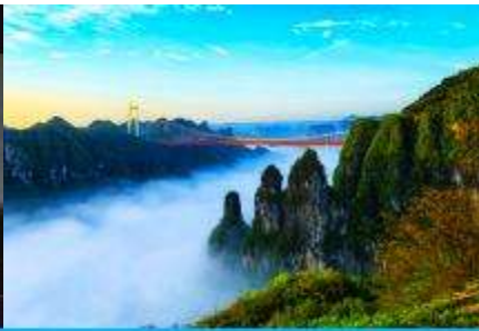
อุทยานป่าไม้แห่งชาติไ้อ้าย