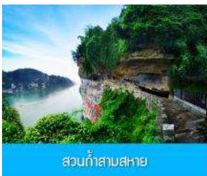
สวนถ้ำสามสหาย