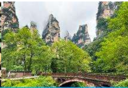
จุดชมวิวจินเปียนซี