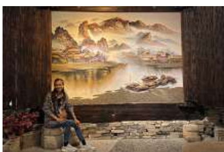
พิพิธภัณฑ์ภาพเขียนหินกราย

พักที่ ZHENMIAN HOTEL OR YINXIANG HOTEL ระดับ 4 ดาวท้องถิ่นหรือเทียบเท่าในเมืองจางเจียเจี๋ย