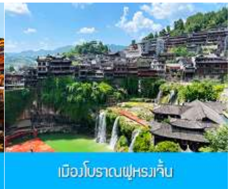
เมืองโบราณฝูหรงเจิน