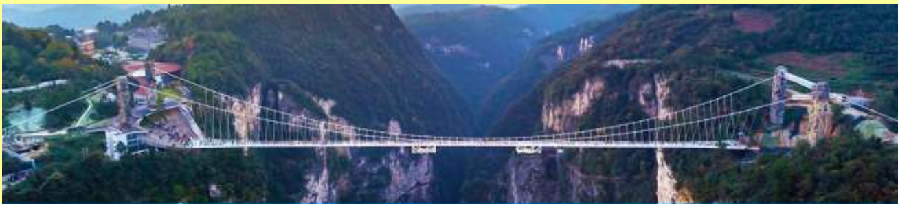
สะพานกระจกข้ามหุบเขาแกรนด์แคนยอน

โปรแกรมเสริมที่ 2 โปรแกรมเที่ยวชมอุทยานภูเขาอวตารแบบครึ่งวันที่รวมค่าขึ้นลิฟท์แก้ว (ผู้เข้าร่วมขั้นต่ำ 15 ท่าน) ใช้เวลาประมาณ 4-6 ชั่วโมง (ขึ้นอยู่กับจำนวนนักท่องเที่ยวในแต่ละวัน) อัตราค่าบริการท่านละ 750 หยวนหรือ 3,750 บาท นำท่านเที่ยวชมจุดชมวิวลำธารจินเปียนซีที่สามารถมองเห็นวิวยอดเขาอวตารได้ชัดเจน นำท่านเที่ยวชมจุดชมวิวดน ลานชมวิวน้ำลิฟท์แก้วไปหลังที่สามารถมองเห็นทัศนียภาพของภูเขาอวตารและ ลิฟท์แก้วได้ชัดเจน นำท่านขึ้นลิฟท์แก้วขึ้นสู่ยอดเขาอวตาร นำท่านเดินชมจุดชมวิวด่าง ๆ บนยอดเขาอวตาร ได้แก่ภูเขาฮาเลลูยา สะพานหนึ่งโนใต้ห้ำ... อัตราค่าบริการรวม ค่าบัตรเข้าอุทยาน ค่ารถรับส่งภายในเขต อุทยาน ค่าน้ำดื่มของไกด์ท้องถิ่น