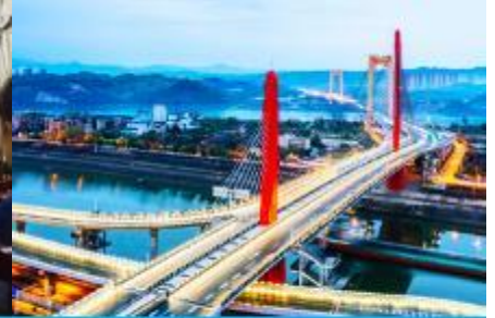
เมืองหยี่ชาง

วันที่ห้า เมืองจางเจียเจี๋ย- เลือกซื้อโปรแกรมทัวร์เสริม OPTIONAL TOUR - ร้านหยก-ร้านใบชา-เมืองหยี่ชาง