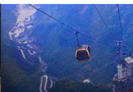
กระเช้าขึ้นเขาเทียนเหมินซาน