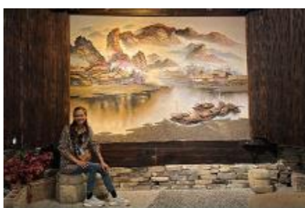
พิพิธภัณฑ์ภาพเขียนหินทราย

พักที่ ZHENMIAN HOTEL OR YINXIANG HOTEL ระดับ 4 ดาวท้องถิ่นหรือเทียบเท่าในเมืองจางเจียเจีย