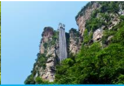
ลิฟท์แก้วไปหลม