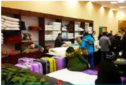
ศูนย์จำหน่ายผลิตภัณฑ์ยางพารา

พักที่ ZHENMIAN HOTEL OR YINXIANG HOTEL ระดับ 4 ดาวท้องถิ่นหรือเทียบเท่าในเมืองจางเจียเจี๋ย