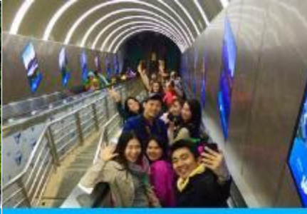
บันไดเลื่อนทะลุภูเขา