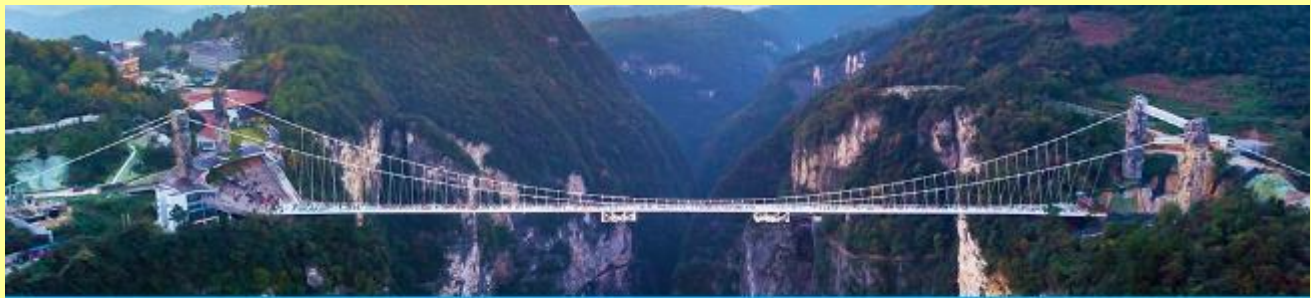
สะพานกระจกข้ามหุบเขาแกรนด์แคนยอน

โปรแกรมเสริมที่ 2 โปรแกรมเที่ยวชมอุทยานภูเขาอวตารแบบครึ่งวันที่รวมค่าขึ้นลิฟท์แก้ว (ผู้เข้าร่วมขั้นต่ำ 15 ท่าน) ใช้เวลาประมาณ 4-6 ชั่วโมง (ขึ้นอยู่กับจำนวนนักท่องเที่ยวในแต่ละวัน) อัตราค่าบริการท่านละ 750 หยวนหรือ 3,750 บาท นำท่านเที่ยวชมจุดชมวิวจินเปียนซีที่สามารถมองเห็นวิวยอดเขาอวตารได้ชัดเจน นำท่านเที่ยวชมจุดชมวิวจินเปียนซี ลานชมวิวน้ำลิฟท์แล้วไปหลงที่สามารถมองเห็นทัศนียภาพของภูเขาอวตารและลิฟท์แก้วได้ชัดเจน นำท่านขึ้นลิฟท์แก้วขึ้นสู่ยอดเขาอวตาร นำท่านเดินชมจุดชมวิวด่าง ๆ บนยอดเขาอวตารได้แก่ภูเขาเสาเสวยราชย์ สะพานหนึ่งในใต้หล้า... อัตราค่าบริการรวม ค่าบัตรเข้าอุทยาน ค่ารถรับส่งภายในเขตอุทยาน ค่าน้ำดื่มของโปรดท้องถิ่น