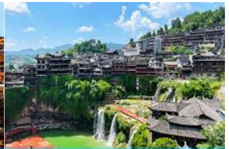
เมืองโบราณผู่หรงเก๋น