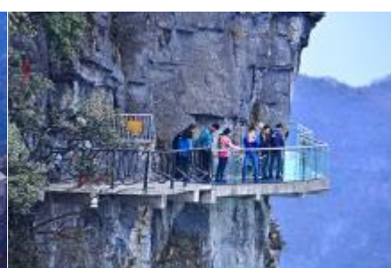
หน้าผาลอยฟ้าทางเดินกระจก