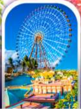
เมืองแฟนตาซี