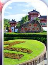
อุทยานหนานซาน

ทางเดินริมชายทะเลซานย่า - ทุ่งดอกกุหลาบอ่าวย่าหลง อุทยานหนานซาน - เทียบบนเกาะดอกไม้ - ทุ่งเกลือหินปี ช้อปปิ้งในท่ามาร์ทักถนนโบราณฉีไห่ลว