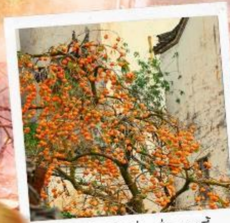
柿柿如意 ชื่อ ชื่อ หยูอี้ ลูกพลับแห่งความราบรื่น