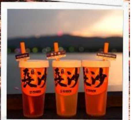
เซียงเจียงริเวอร์ไซด์