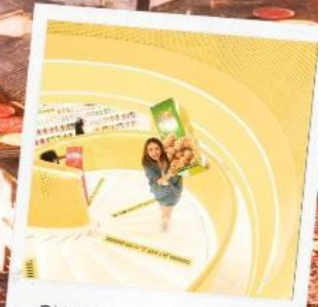
SNACK BUSY STATION