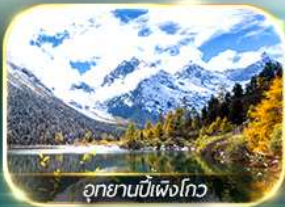
อุทยานบิ๋นเฟิงโกว