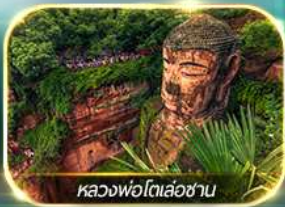
หลวงพ่อดิลอ่ชาน