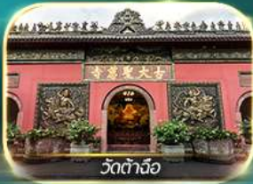
วัดต้าจื่อ