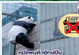
หมีแพนด้ายักษ์ปิ่น ตึกถนนซุนชี่ตู้