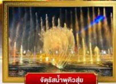
จัตุรัสน้ำพุควิสู่