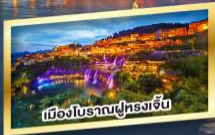
เมืองโบราณฟูหลงเจิ้น