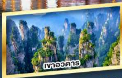
เขาอวตาร