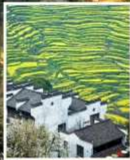
หมู่บ้านโบราณหวงหลิ่ง