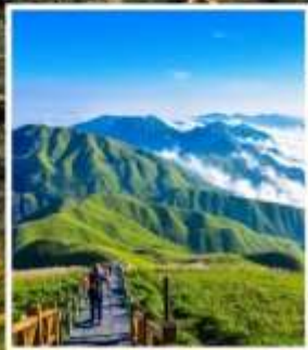
เขาอู่กงซาน