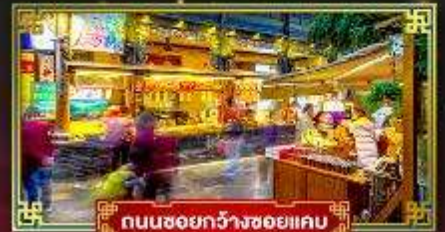
ถนนชอยกว้างชอยแคบ