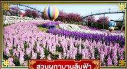
สวนผกานานสันฟ้า