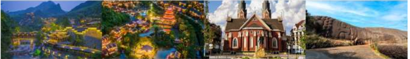
หุ่นเขาเทวดาวังเซียนกู่