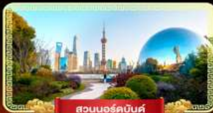
สวนนอร์คบันด์