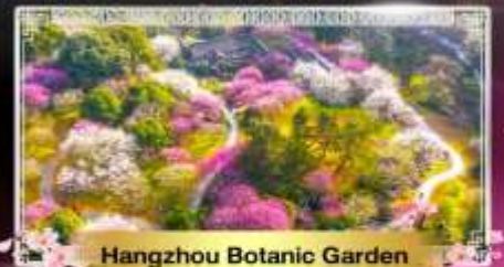
Hangzhou Botanic Garden