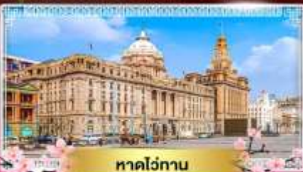
หาดไถ่ทวน

"ชมดอกซากุระนลิบาน ณ แดนมังกร" ล่องเรือทะเลสาบตะวันตก ไข่มุกแห่งหางโจว