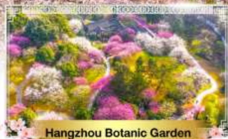
Hangzhou Botanic Garden