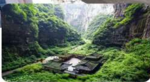
อุทยานหลุมขี้เถ้า