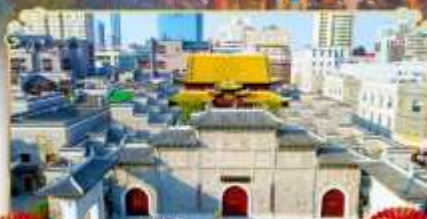
ถนนโบราณวังไช่กวง