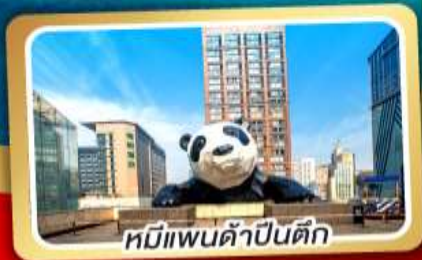
หมีแพนด้าปิ่นตึก