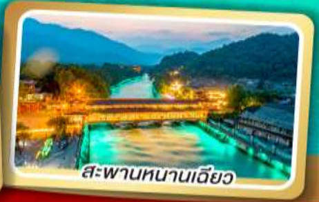
สะพานหนานเฉียว