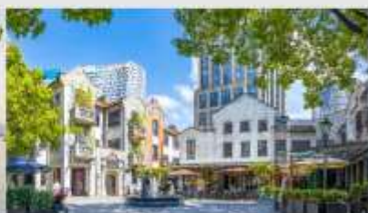
ย่านซินเทียนตี้