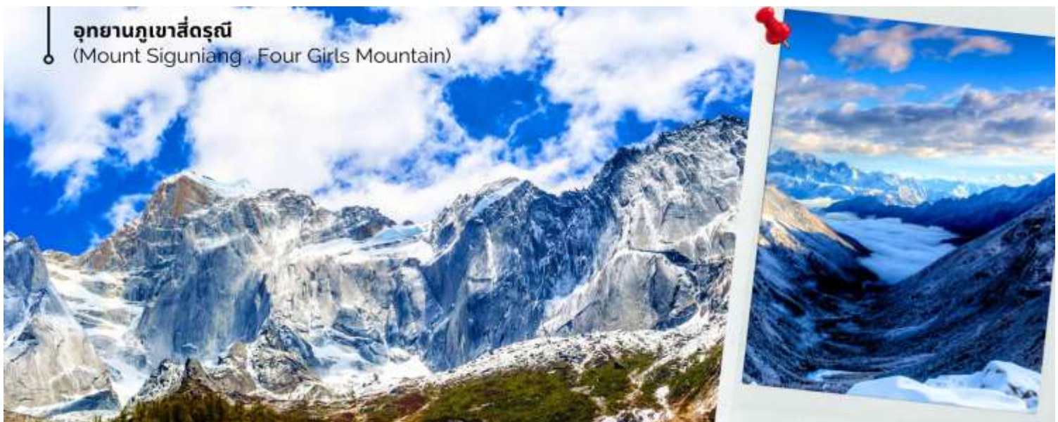
อุทยานภูเขาสี่ดรุณี (Mount Siguniang . Four Girls Mountain)

นำท่านเดินทางสู่ อุทยานภูเขาสี่ดรุณี (Mount Siguniang หรือ Four Girls Mountain) หรือชื่อเรียกในภาษาจีนว่า 'ซื่อกุเหนียงซาน' (เดินทางด้วยรถบัสจากเมืองเฉิงตู ใช้เวลาเดินทางประมาณ 3-4 ชั่วโมง) อยู่สูงกว่าระดับน้ำทะเลราว 5,000 เมตร ตั้งอยู่ในอำเภอเสี่ยวจิน เขตปกครองตนเองชนชาติทิเบตและเซียงอาป่า มณฑลเสฉวนทางตะวันตกเฉียงใต้ของจีน ห่างจากนครเฉิงตูราว 220 กิโลเมตร เป็นส่วนหนึ่งของอุทยานฉางผิง ชาวทิเบตเรียกขานกันในนามเทพศักดิ์สิทธิ์ "Skola" ซึ่งแปลว่า "เทพเจ้าผู้ปกป้องรักษา" เป็นหุบเขาที่งดงามจนได้รับการขนานนามว่า ภูเขาแอลป์แห่งเมืองเสฉวน ด้วยลักษณะรูปทรงของยอดเขาสี่ลูกที่เรียงรายติดกัน เมื่อมองจากระยะไกลจะเห็นยอดเขาปกคลุมไปด้วย