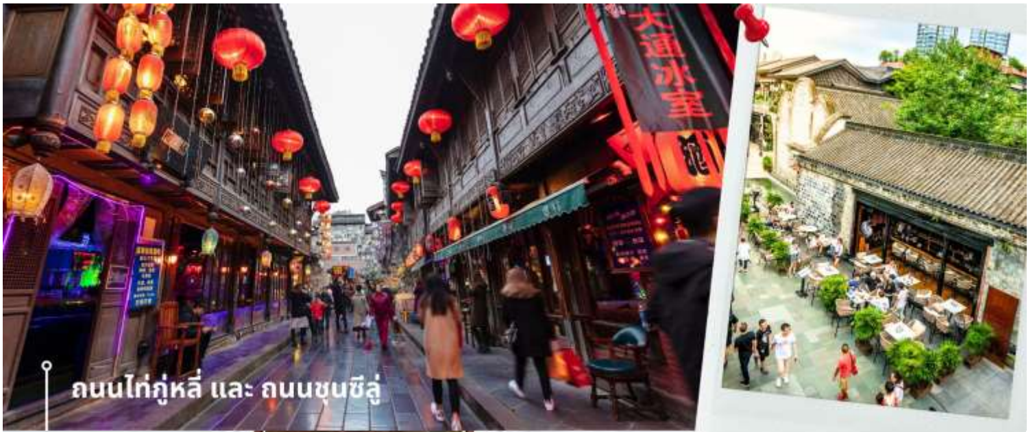
ถนนไท่กุ่หลี่ และ ถนนชุนซีลู่