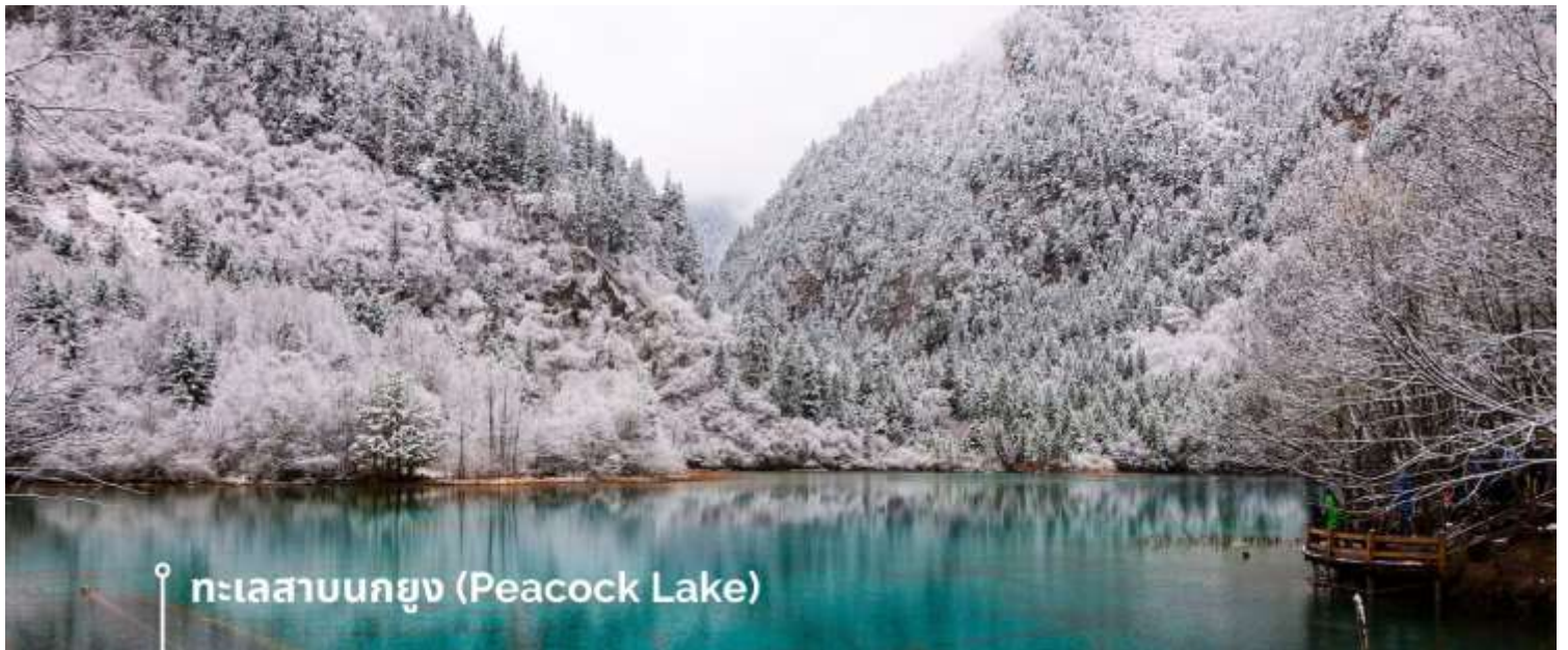
ทะเลสาบนกยูง (Peacock Lake)