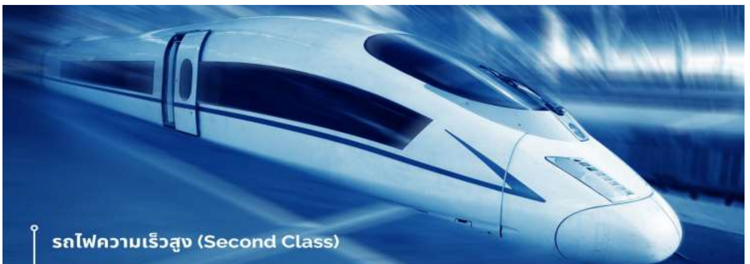
รถไฟความเร็วสูง (Second Class)

นำท่านเดินทางสู่สถานีรถไฟ เพื่อเดินทางด้วย รถไฟความเร็วสูง กลับสู่เมืองเฉิงตู ใช้เวลาเดินทาง ประมาณ 3 ชั่วโมง