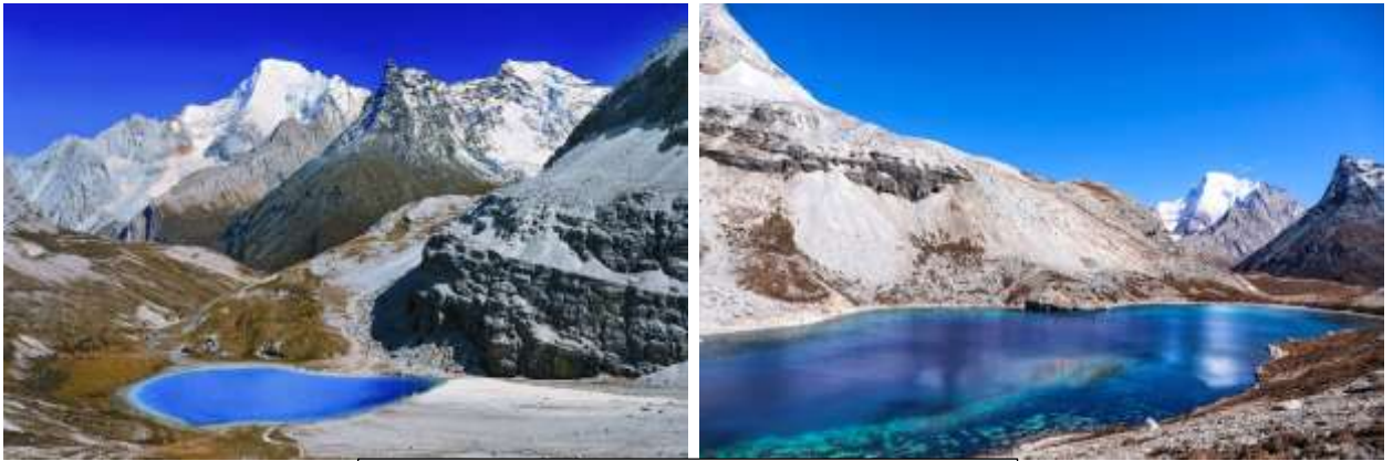
https://www.tibet-tours.com/845-4-Day-Tour-of-Daocheng-Yading.html Photo: Wang Lei

เดินขึ้นเขาไปอีกเล็กน้อย นำท่านชมทะเลสาบ 5 สี (Five Color Lake) ตั้งอยู่ระหว่างภูเขา Xiannairi และ Yangmaiying สูงจากระดับน้ำทะเล 4,700 เมตร ทะเลสาบมีลักษณะเป็นแอ่งกลมและน้ำใสสะท้อนแสงหลากสี สีสันซึ่งงดงามมาก คนในท้องถิ่นกล่าวว่า ความใสของทะเลสาบแห่งนี้ สามารถ "ย้อนอดีตและทำนายอนาคตได้"