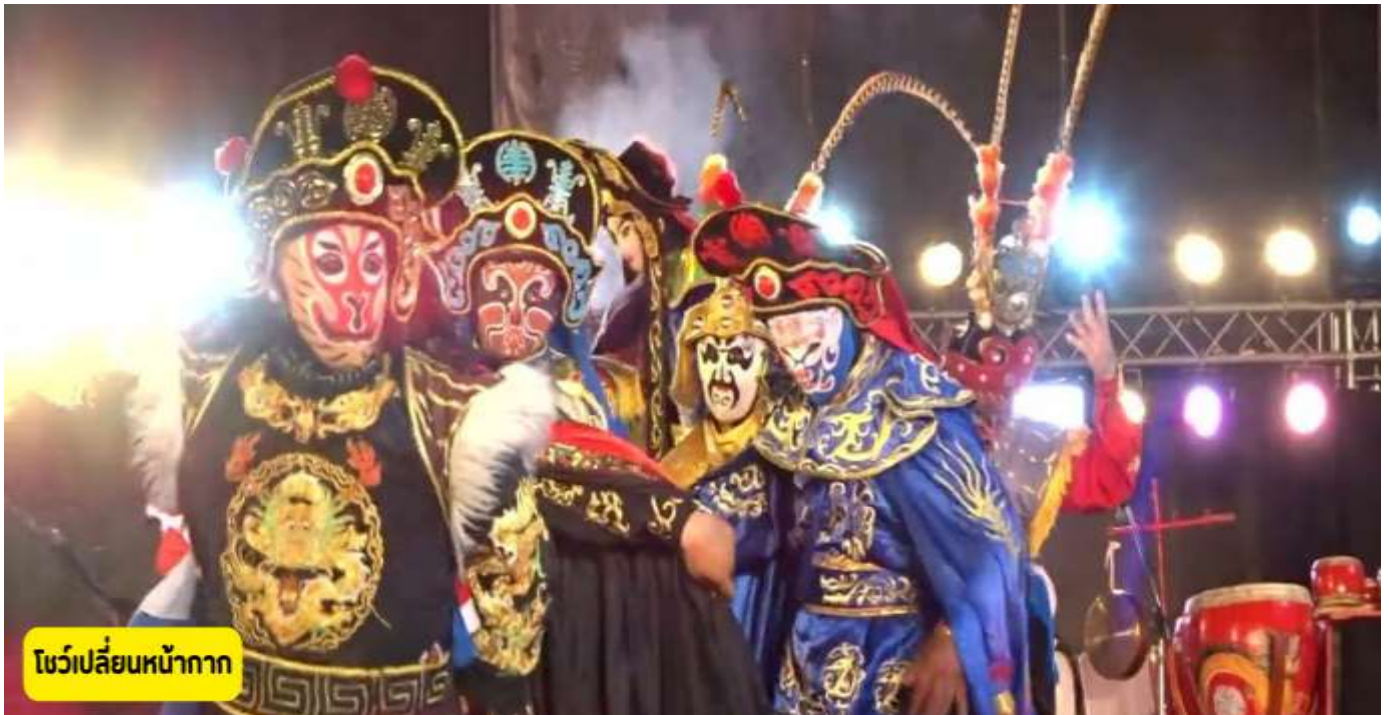
โชว์เปลี่ยนหน้ากาก

เล่าซาน - ฉินตู – ถนนโบราณจินลี่ - ถนนคนเดินชุนชี่ลู่ - โชว์เปลี่ยนหน้ากาก