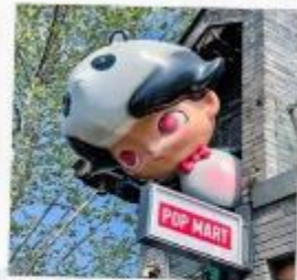
ชอยกวางแดบ